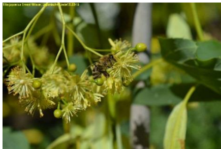
Tilia japonica Ernest Wilson