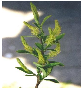
Salix continua triandra semperflorens

31832 Springe, OT. Bennigsen Immengarten 1 Tel.: 05045 / 8383, Fax: / 8104 www.immengarten-jaesch.de